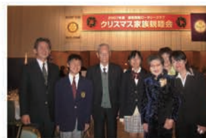
クリスマス親睦会