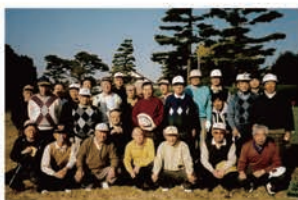
親睦ゴルフコンペ